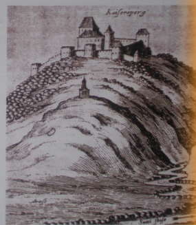
Cesargrad, bakrorez G.M. Vischera, 1681

Pretpostavlja se da je grad sazidan u drugoj polovici 13. ili početkom 14. stoljeća, a prvi put se spominje 1399. godine, kada ga kralj Žigmund dariva Hermanu Celjskom. Nakon što su Celjski izumrli, grad dobiva Andrija Baumkircher koji ga je zadržao do smrti, iako je i Ivan