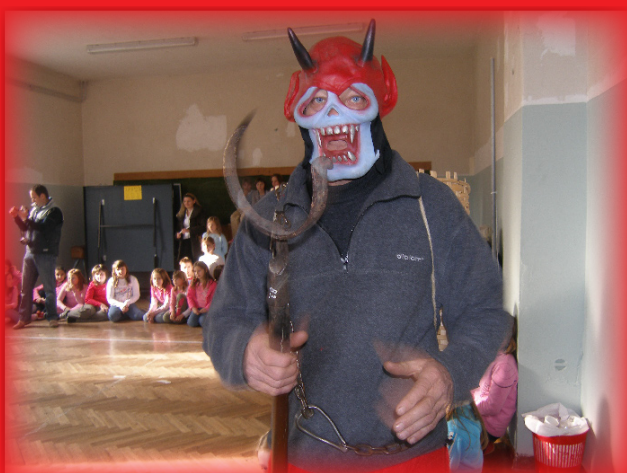
„Bjež“, Krampus! Hoćemo Svetoga Nikolu!”

A stariji učenici, budući da su odrasliji i preozbiljni za ovakve stvari, samo ljubazno uzmu svoje darove i navale na čašćenje. Možda bi se i oni poželjeli slikati s Nikolom i Krampusom, ali pod uvjetom da oni odgovaraju današnjim „trendi“ mjerilima, kako po modnim kriterijima, tako i po tjelesnim proporcijama i da k tome još dolaze i u parovima, Sveti Nikola i Krampus i