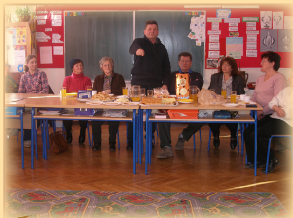
Bake i djedovi u školi