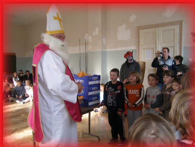
„Da, da, svi smo bili jaaaako dobri. i sljedeće godine bit ćemo joooooš bolji! Možemo li sada dobiti darove?“