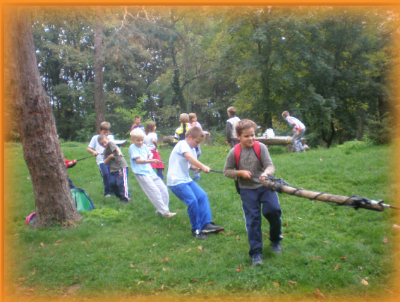
I opet igraaaaa....