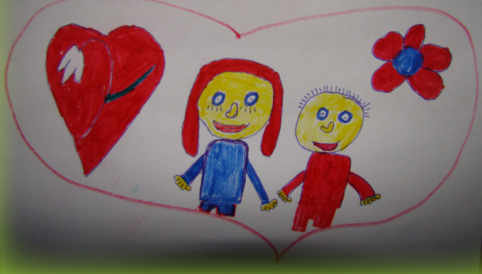
Iz razrednog kalendara za veljaču

Veljača je mjesec ljubavi. U veljači je zima. Rastu nove višibabe.