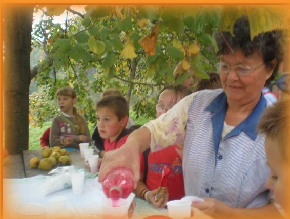
Kod obitelji Štih